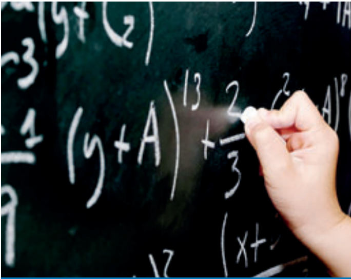
La festa vol acostar les mates als més petits.