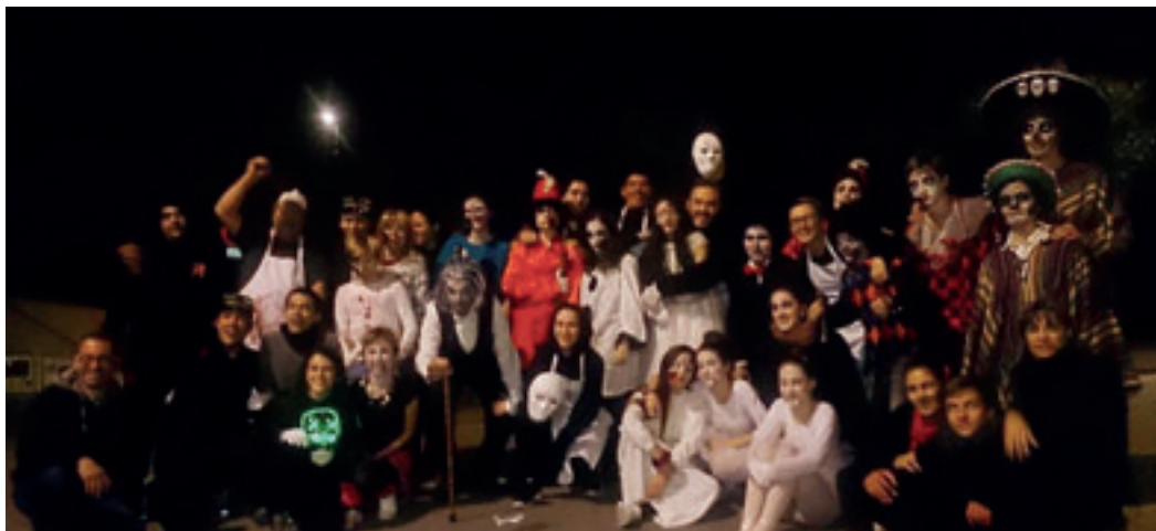
Participants de l'any passat disfressats.