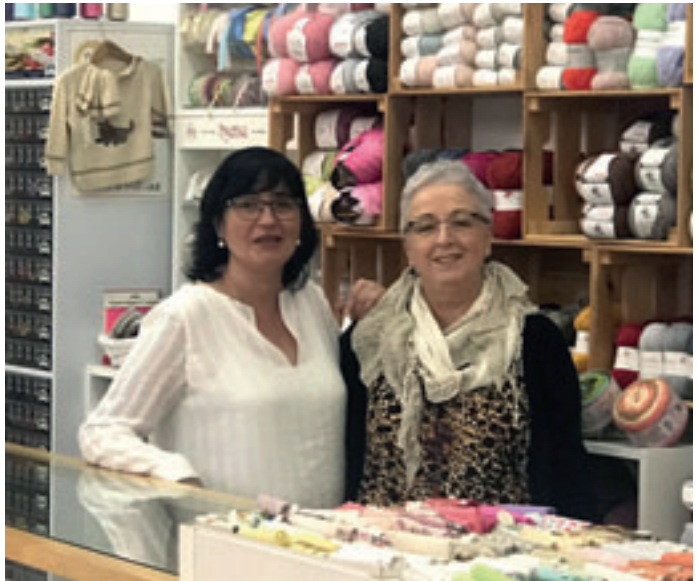
Les dues propietaries de la merceria Viorne.