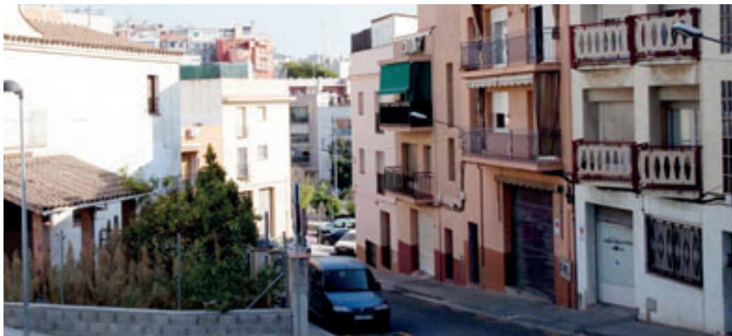
La Llàntia és considerat un dels barris més tranquils de la ciutat.