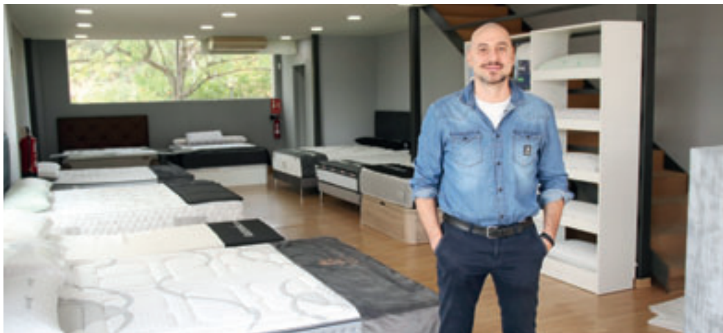
Kolchonia té una altra botiga a l'avinguda Meridiana de Barcelona.