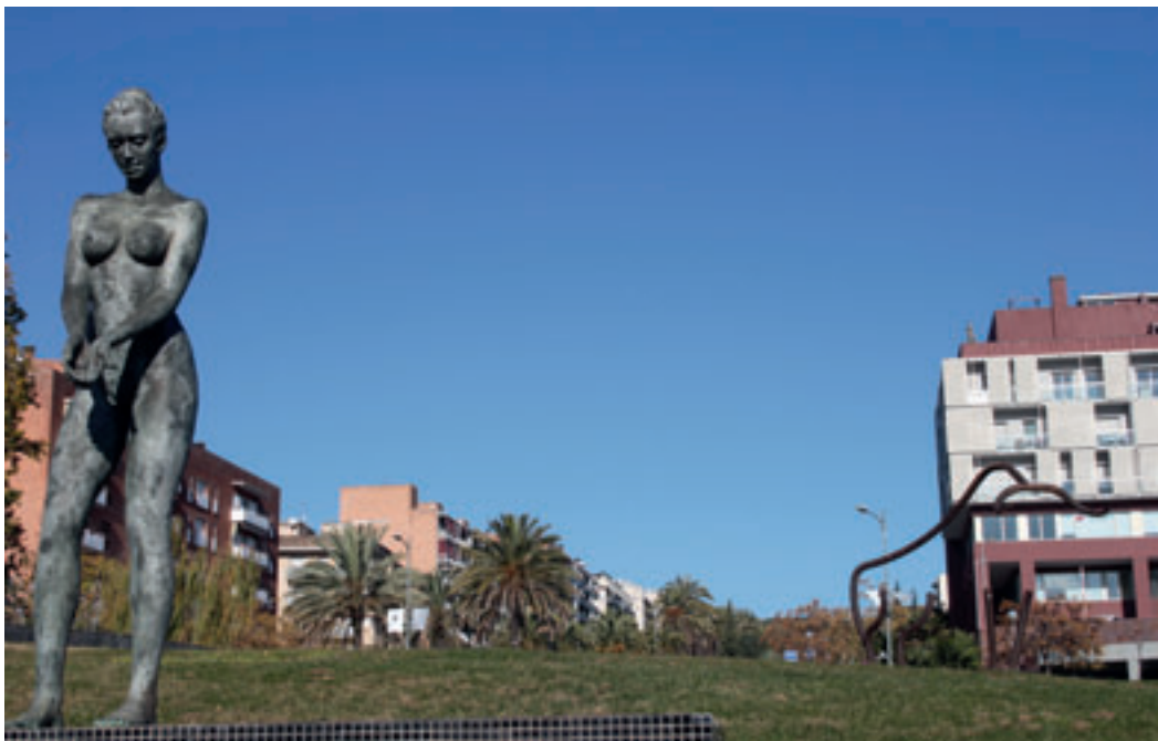
La composició escultòrica.