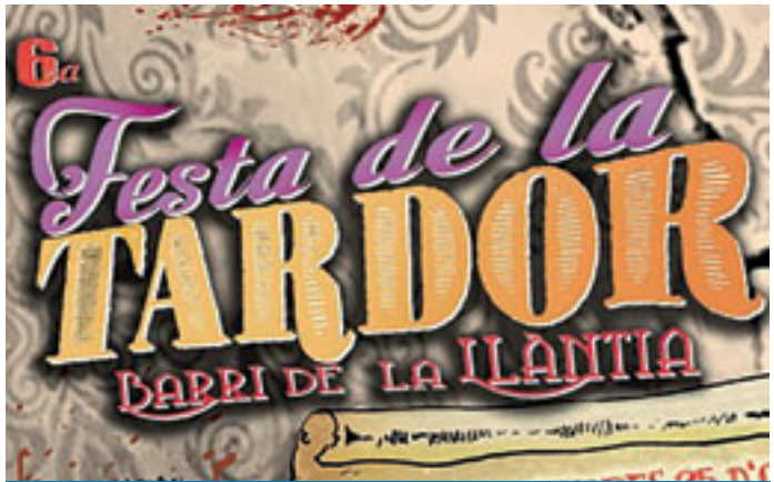
La festa celebra la 6a edició aquesta tardor.

Cercavila de disfresses: 19 hores · sortida del Parque Rojo (entre el carrer Irlanda i el carrer la Boixa) fins al Parc de la Llàntia. / Els Geganters de la Llàntia, amb la col·laboració